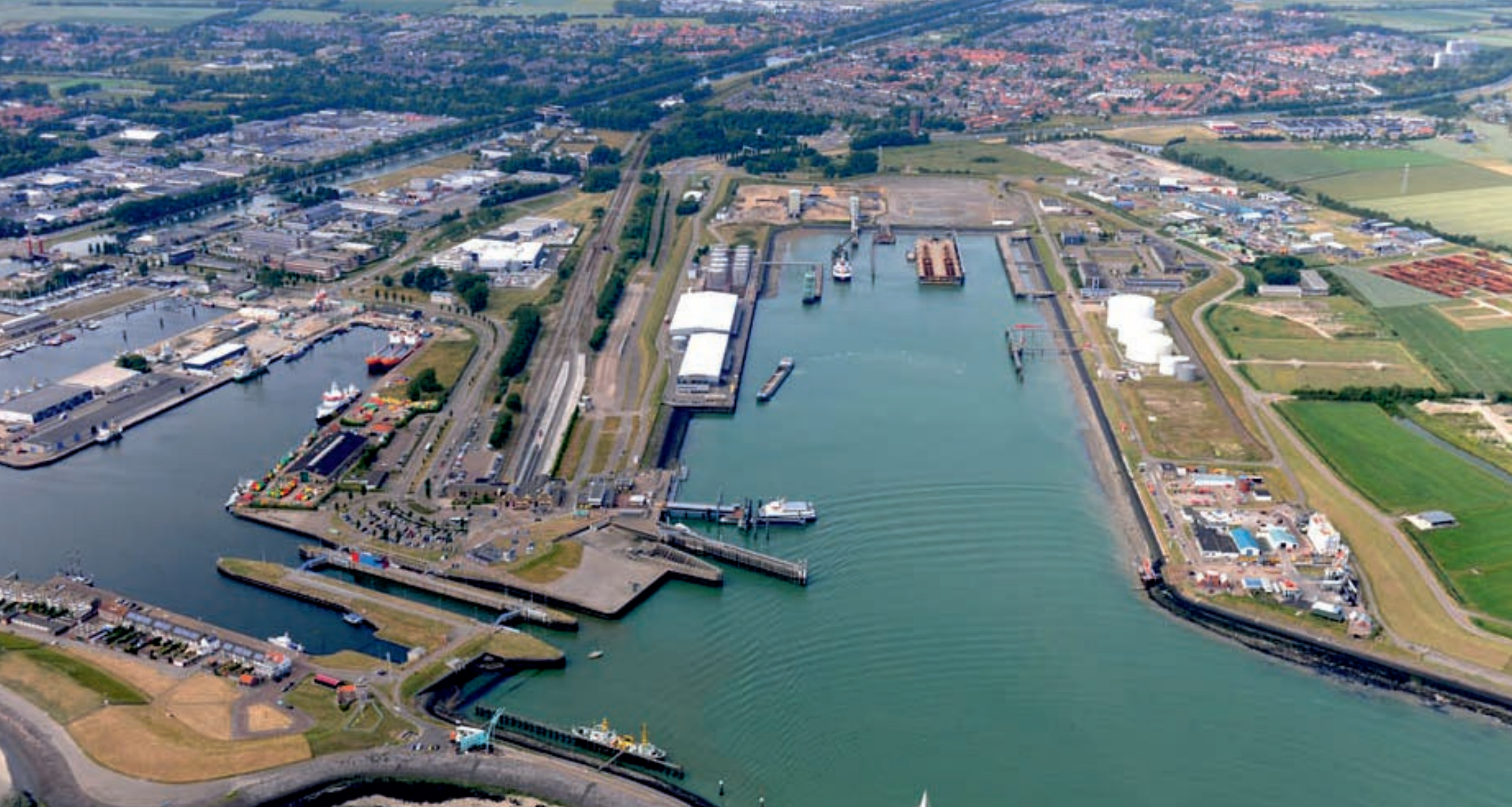
Fiche G: Industrie en haven